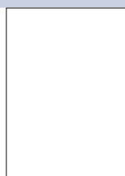
Crystal White HW