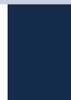
Deep Ocean Blue CM