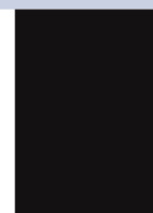
Stone Black BG