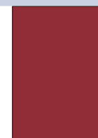
Blushing Red NB