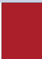
Electric Red H4