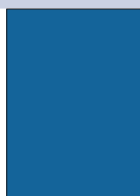
Alpine Blue DE